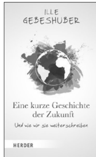
Ille C. Gebeshuber Eine kurze Geschichte der Zukunft – Und wie wir sie weiterschreiben Herder-Verlag

Grafiken, Fotos, Musik, Texte, Videos etc. gehören dem Erschaffer des jeweiligen Werks. Wer sie verwenden möchte, muss sich an das Urheberrecht halten. Das bedeutet, dass man das Recht hat, diese Inhalte in der verwendeten Form wie beispielsweise im Internet zu benutzen. Der Erschaffer kann auch bestimmen, in welcher Form dieser genannt werden möchte. So ist bei Fotos normalerweise der Fotograf zu nennen. Weiters schützt die DSGVO die gezeigten Personen und sie müssen gefragt werden. Wer sich nicht an Urheberrecht und Datenschutz hält, riskiert Klagsdrohungen mit pauschalen Schadenersatzforderungen.